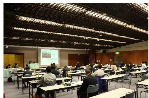
【協議会の様子】(高知地域)