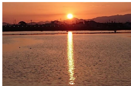
高松市木太町大池にて

四国支部が、これまでの長きにわたり測量技術並びに測量技術者の地位向上と正確な測量成果の提供を通じて、測量業界の発展のために多大な貢献を尽くされたことに対し、こころから敬意を表します。また、会員の皆様には、旧年中、国土地理