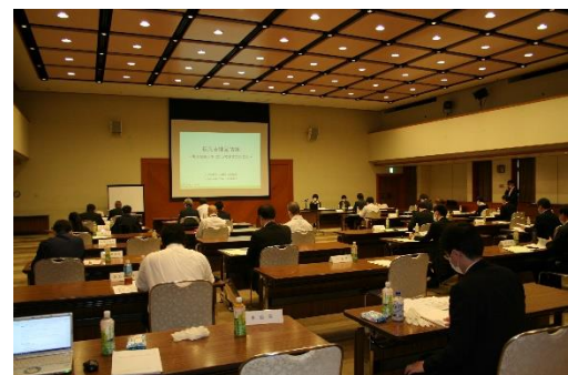
【協議会の様子】(愛媛地域)