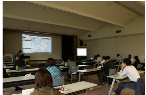
【協議会の様子】(徳島地域)